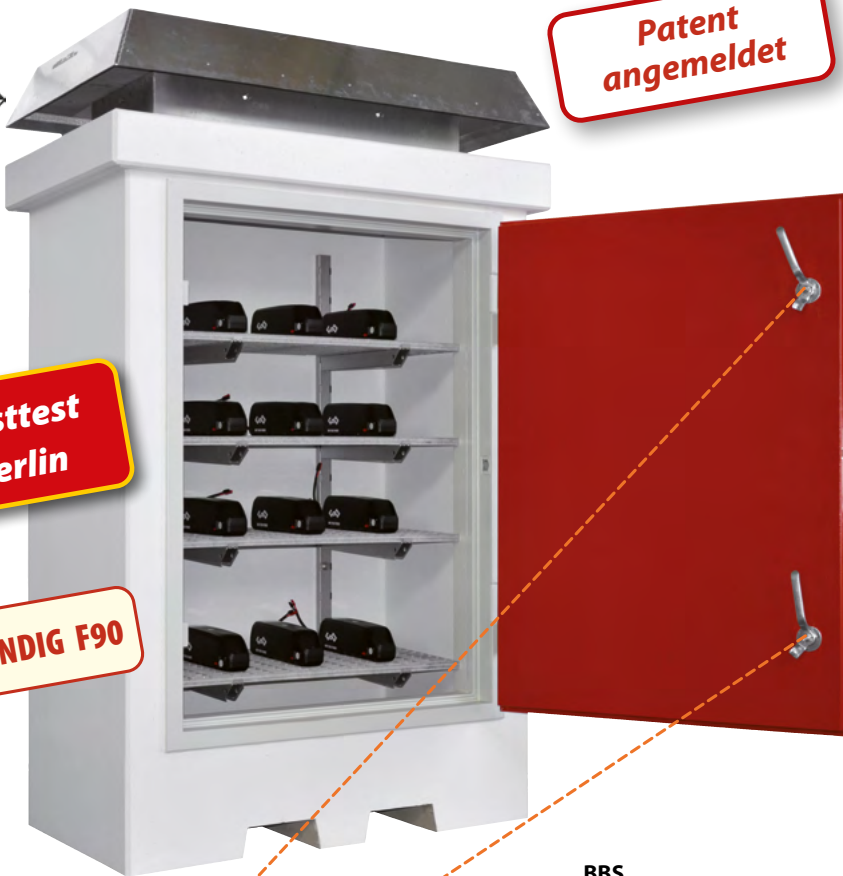
BBS, Artikel-Nr. C62-2015-B, mit optionalem Außenanstrich