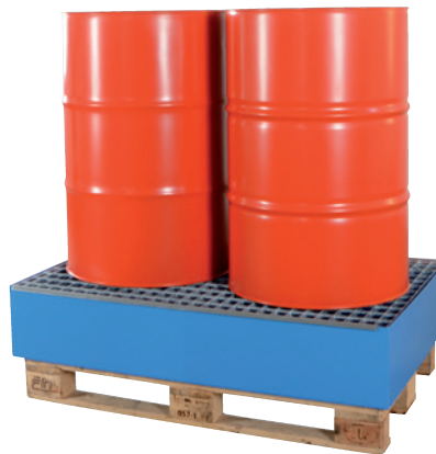
EW 2, lackiert, inkl. Gitterroste, Artikel-Nr. P66-2303-A

* maximale Kapazität bei Verwendung mit verzinktem Gitterrost