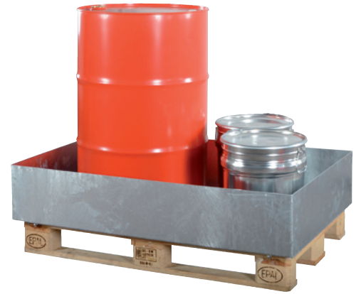
EW 2, feuerverzinkt, ohne Gitterroste, Artikel-Nr. P66-1301-A