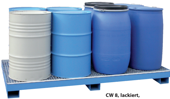
CW 8, lackiert, Artikel-Nr. P65-2005-A