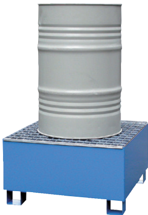
CW 1, lackiert, Artikel-Nr. P65-2001-A