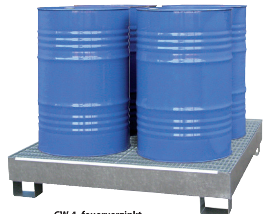
CW 4, feuerverzinkt, Artikel-Nr. P65-1003-A