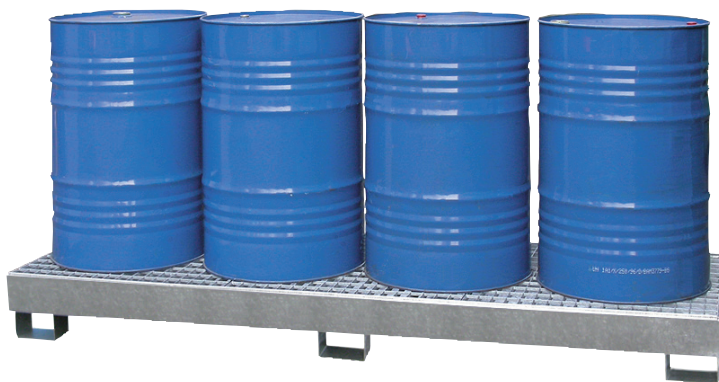
CW 4L, feuerverzinkt, Artikel-Nr. P65-1004-A