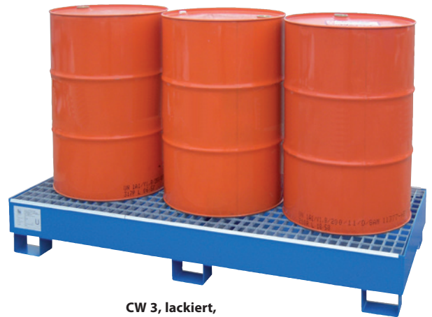
CW 3, lackiert, Artikel-Nr. P65-2007-A