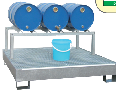
CW 4, feuerverzinkt, Artikel-Nr. P65-1003-A, mit optionalem Fassbock