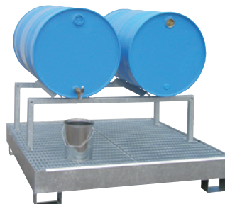
FB 2, Artikel-Nr. P21-1702-A, auf optionaler Auffangwanne CW 4