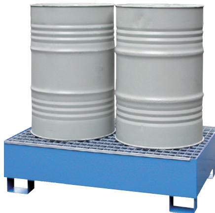
CW 2, lackiert, Artikel-Nr. P65-2002-A