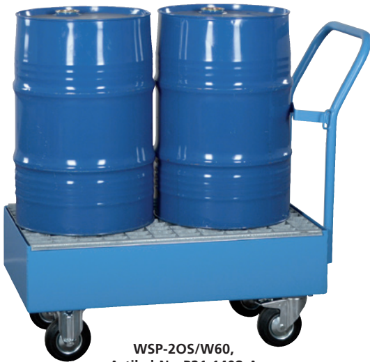
WSP-20S/W60, Artikel-Nr. P21-1408-A