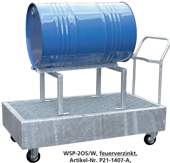
WSP-20S/W, feuerverzinkt, Artikel-Nr. P21-1407-A, mit optionalem Fassbock