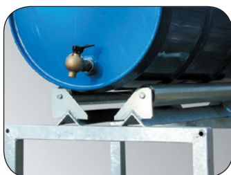
Drehbare Rollenauflage, Artikel-Nr. Z50-1925-B