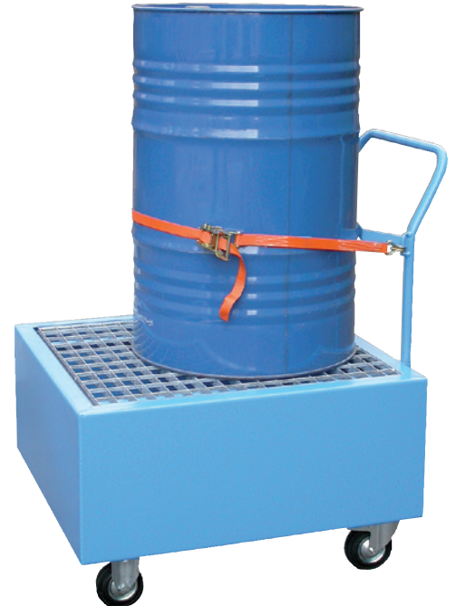
WSP-10S/W, Artikel-Nr. P21-2406-A, mit optionalem Zurring

Passende Fassböcke finden Sie auf Seite 17!