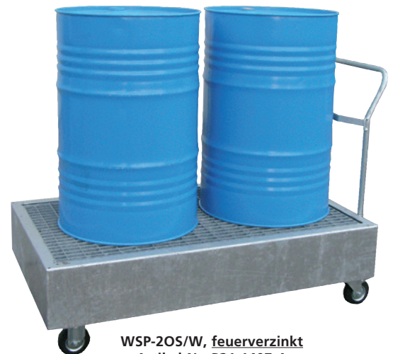
WSP-20S/W, feuerverzinkt, Artikel-Nr. P21-1407-A

Fahrbare PE-Auffangwannen finden Sie auf Seite 41!