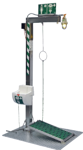
Ausführungsbeispiel mit Beheizung

Notduschen müssen 24 Stunden am Tag, 7 Tage die Woche funktionsbereit sein. Dies gilt auch bei Aufstellung in Außenbereichen bei Temperaturen unter dem Gefrierpunkt. Hier kommt bei unseren Duschen ein selbstregelndes Begleitheizkabel in Verbindung mit einem Isolierpaket zur Gewährleistung der Frostfreiheit zum Einsatz. Ein integriertes Thermostat regelt das System. Alle wasserführenden Teile sind zusätzlich mit einem Isolierpaket mit Edelstahlabdeckung gegen starken Frost gesichert. Sie können zwischen verschiedenen Ausführungen und Zubehörteilen wählen.