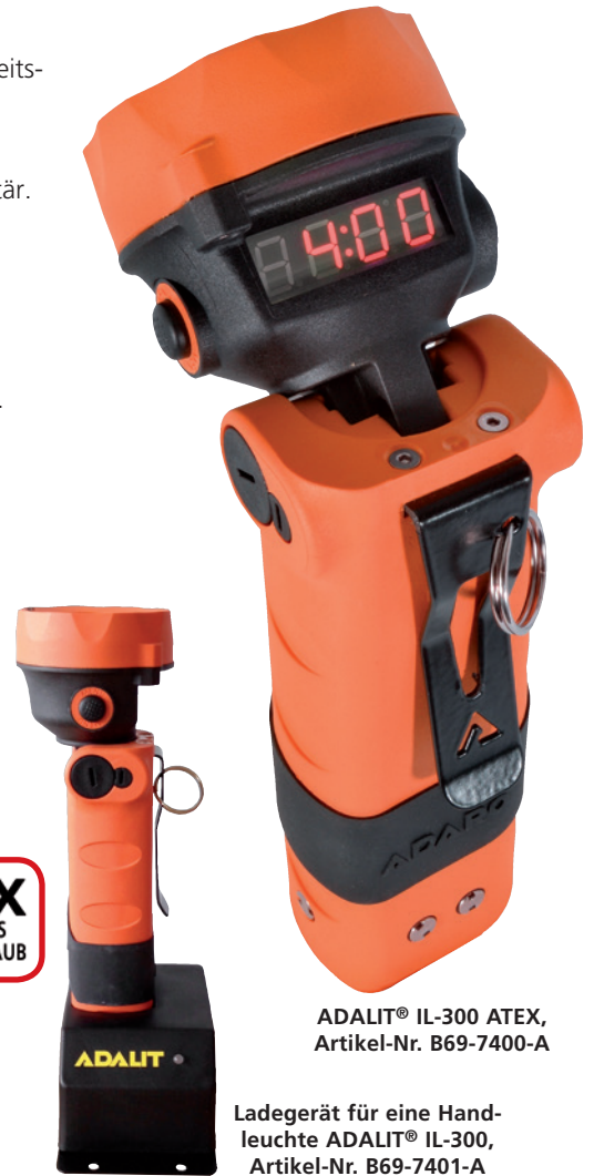
ADALIT® IL-300 ATEX, Artikel-Nr. B69-7400-A