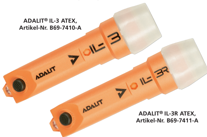
ADALIT® IL-3R ATEX, Artikel-Nr. B69-7411-A