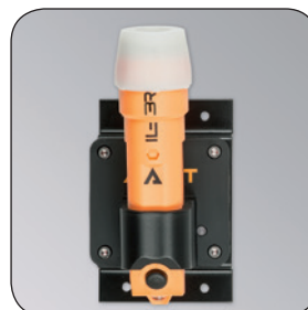
Ladegerät ADALIT® IL-3R ATEX, Artikel-Nr. B69-7412-A