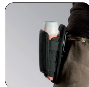
Holster um 360° drehbar ADALIT® IL-3 / IL-3R ATEX, Artikel-Nr. B69-7271-A