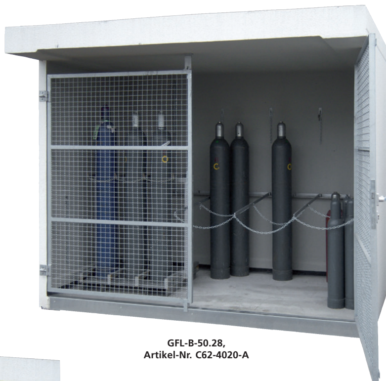
GFL-B-50.28, Artikel-Nr. C62-4020-A

Durch die beweglichen Kragarme ist eine flexible Lagerung von Einzelflaschen und/oder Gasflaschenpaletten möglich.