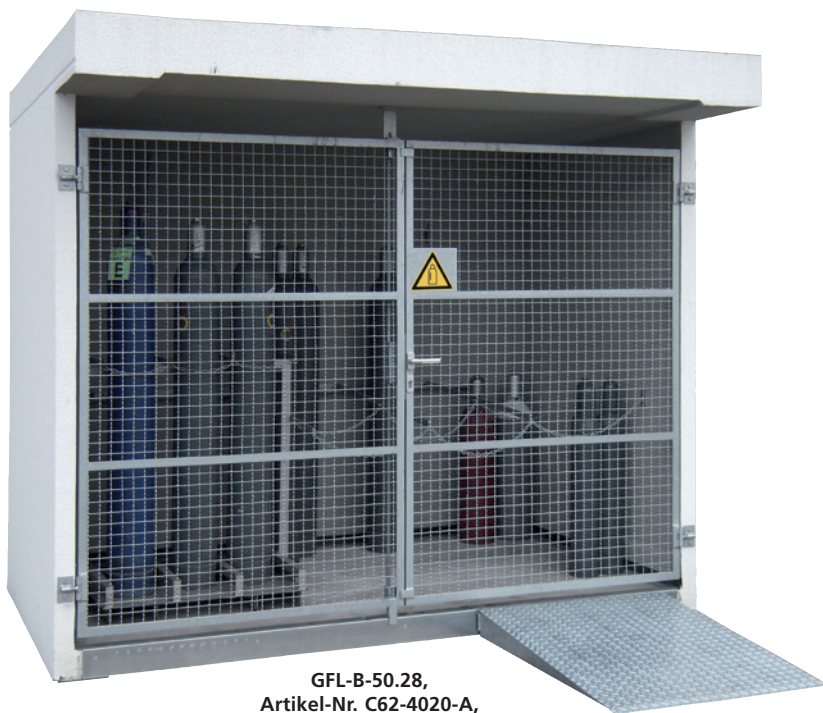
GFL-B-50.28, Artikel-Nr. C62-4020-A, mit optionaler Auffahrrampe