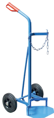
GFR40-V, Artikel-Nr. B69-6430-A