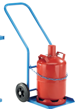
GFR27-V, Artikel-Nr. B69-6433-A