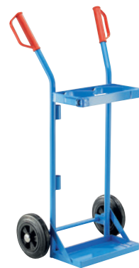
GFR10-V, Artikel-Nr. B69-6432-A