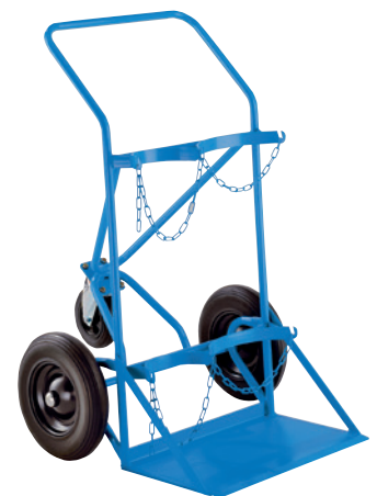
GFK2-VS, Artikel-Nr. B69-6437-A