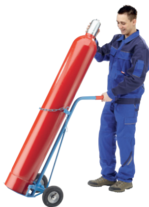
GFR40-L, Artikel-Nr. B69-6431-A