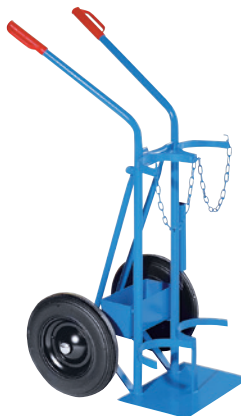
GSW50-VS, Artikel-Nr. B69-6434-A