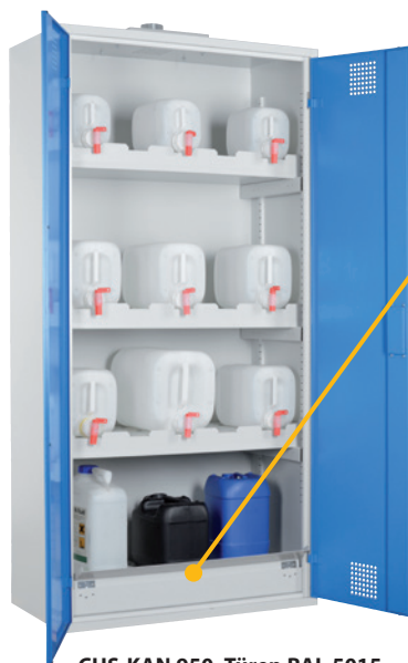
CHS-KAN 950, Türen RAL 5015 Artikel-Nr. B80-6458-A