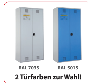
RAL 7035 RAL 5015