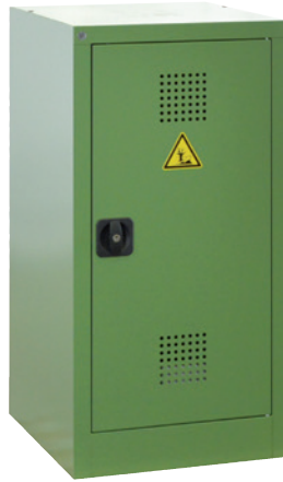
PSM 500-1000 P, Artikel-Nr. B80-6554-A