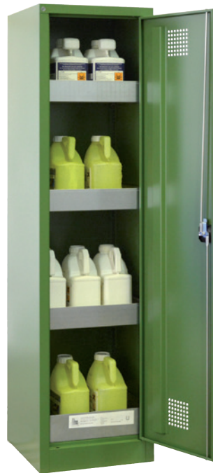
PSM 500 P, Artikel-Nr. B80-6555-A