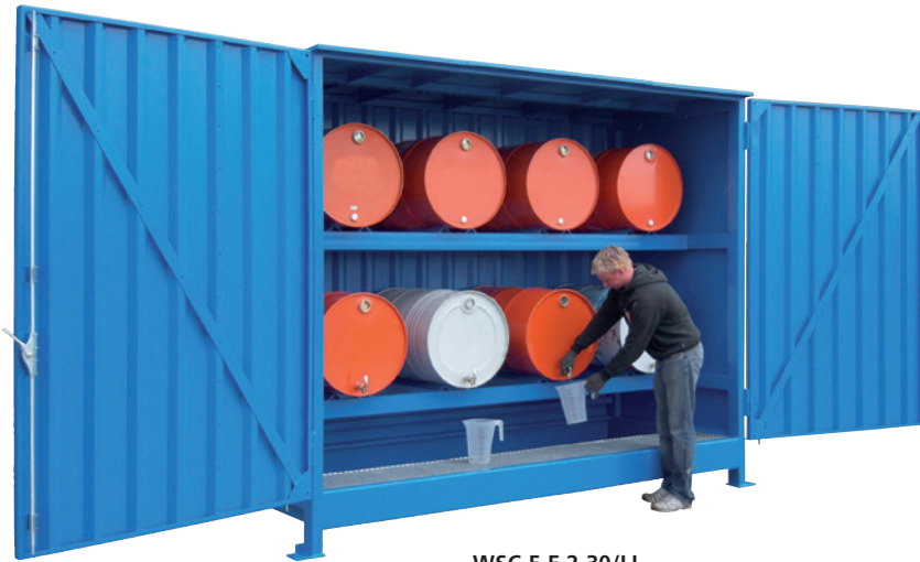
WSC-F-E.2-30/LL, Artikel.-Nr. C22-5401-B