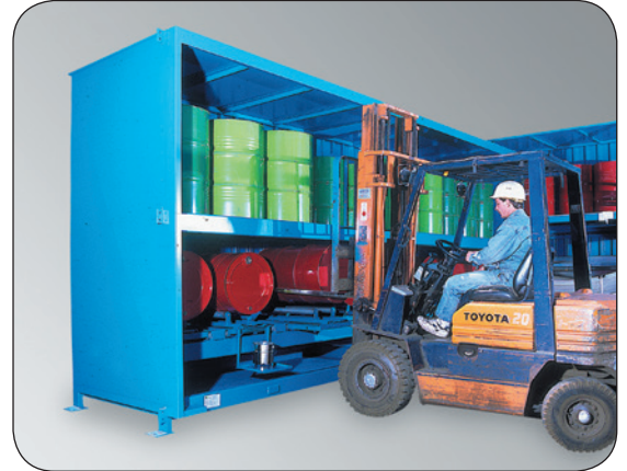
Kombination aus liegender und stehender Lagerung (Rollenauflage und Kannenträger optional) - Preise auf Anfrage !