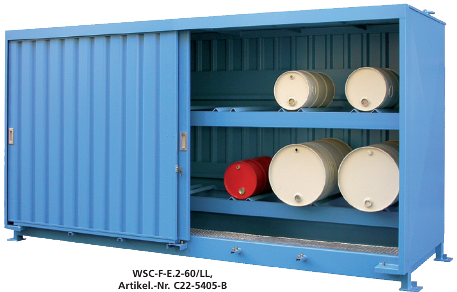
WSC-F-E.2-60/LL, Artikel.-Nr. C22-5405-B